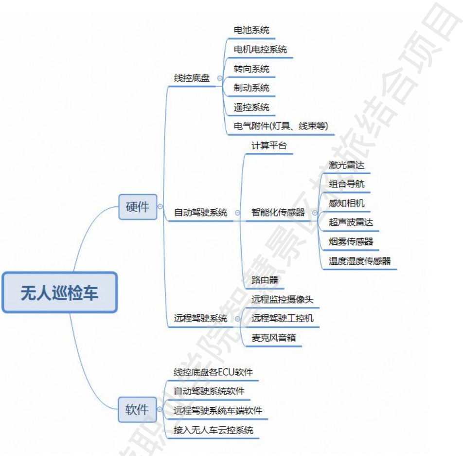
无人巡检车系统架构示意图