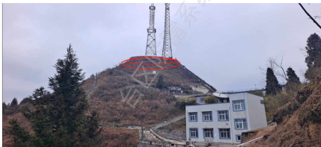
发射铁塔接地网安装平面示意图2