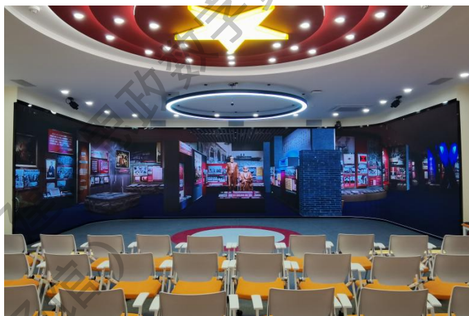
数智长廊U体空间效果图